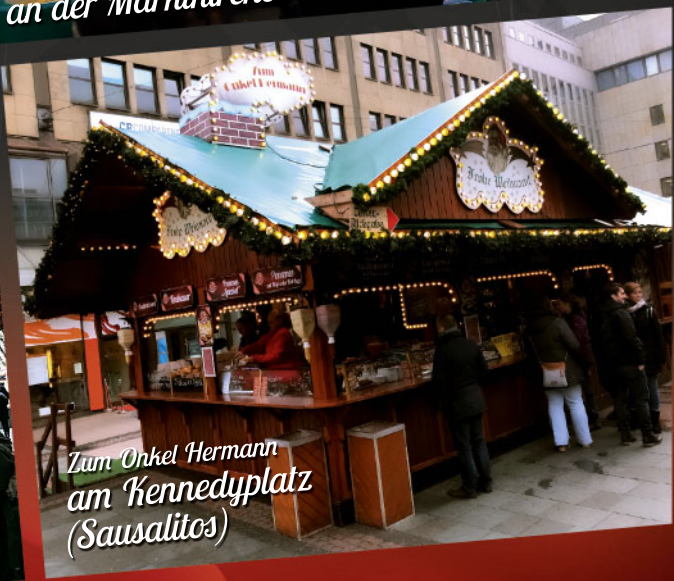
Zum Onkel Hermann am Kennedyplatz (Sausalitos)