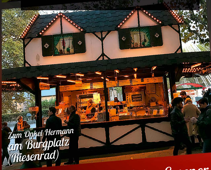
Zum Onkel Hermann am Burgplatz (Riesenrad)