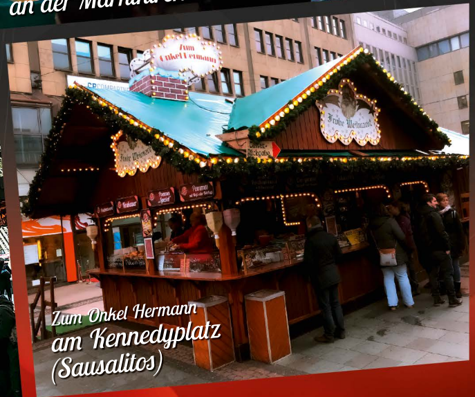
Zum Onkel Hermann am Kennedyplatz (Sausalitos)

Besuchen Sie uns auf den Essener Lichtwochen! Wir freuen uns auf Sie!